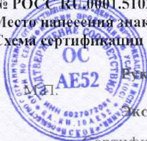
Схема сертификации 4.

Место нанесения знака соответствия: на информационном стенде